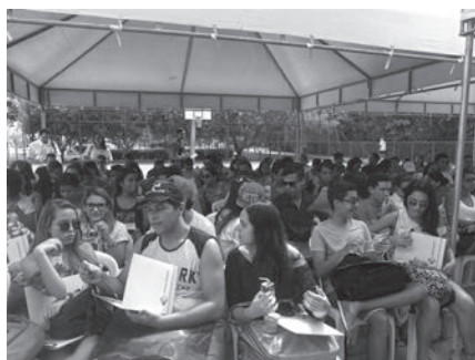
I Aula Pública sobre Acessibilidade