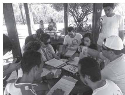
Oficina de Sistema Braille