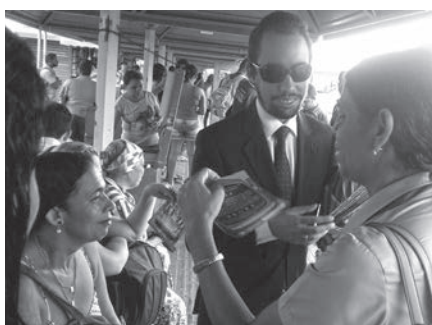
Campanha Pratique Cidadania: Deixe o assento preferencial livre para quem precisa.