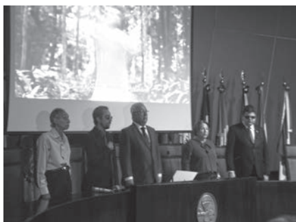
I Audiência Pública Aracaju Acessível: Inovações da Lei Brasileira da Inclusão.