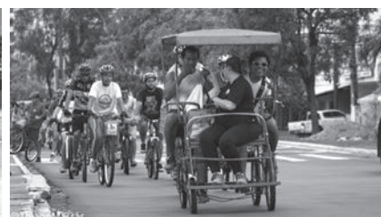
I Pedal Cultural Acessível