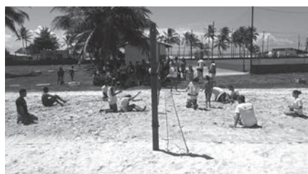
III Jogos Cidadãos